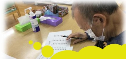
脳トレやぬりえに一生懸命取り組まれています。